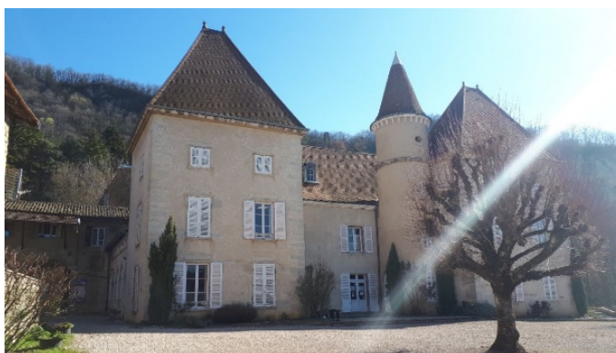
IFAS SAINT SORLIN

10 place de la Halle 01150 ST SORLIN EN BUGEY